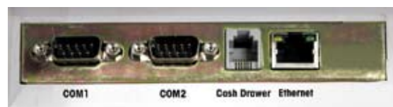
Alle wichtigen Schnittstellen vorhanden

CE „Conformité Européenne“ Dieses Zeichen bietet Gewähr, dass diese Waagen den neuesten EG-Richtlinien entsprechen und fertig geeicht geliefert werden können.